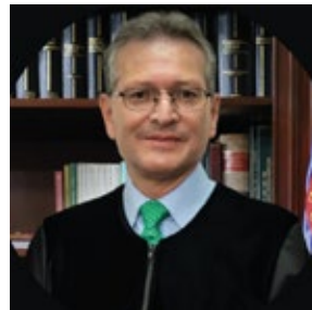
Fredy Ibarra Consejero de Estado