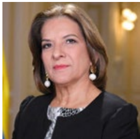
Margarita Cabello Procuradora General de la Nación