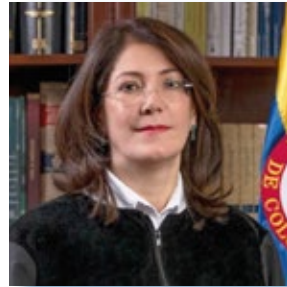
Marta Nubia Velásquez Ex-consejera de Estado