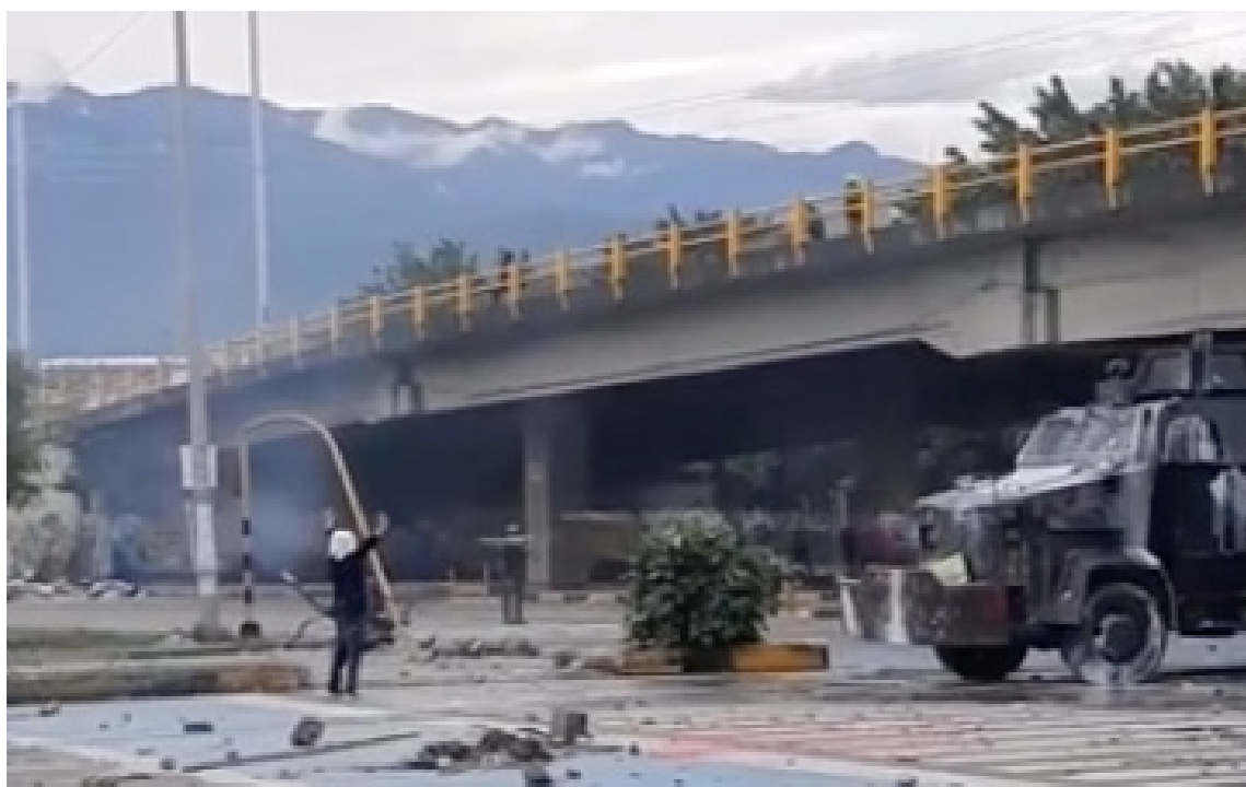
Pantallazo de uno de los videos verificados por DVC de Amnistía Internacional, en el que se puede identificar a una persona con sus manos arriba frente a una tanqueta. En la toma es posible ver el disparo directo de una granada de gas lacrimógeno contra su cuerpo, que logra impactar su cabeza. Cali, Valle del Cauca, 3 de mayo 82 .

En varios videos y fotos se pudo determinar, además, el uso desproporcionado de armas potencialmente letales como los bolillos, elementos que deberían ser usados en limitadas situaciones para responder a un riesgo inminente. Sin embargo, la evidencia audiovisual recogida sugiere que los agentes de Policía en Colombia usan el bolillo para golpear a los manifestantes directamente en la cabeza y en el cuello, lo que evidentemente implica un riesgo elevado de causar lesiones graves, incluidos traumas oculares 81 . El uso indiscriminado de estos elementos en casos en los que no es posible determinar una situación de riesgo elevado, supone una conducta contraria al derecho internacional.